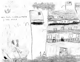
Un Aruba bunita cu mata y hopi bestia

ta importa Hulandesnan por ehempel y nos lo ta dilanti di un NEO-COLONIALISMO. Actualmente ta asina cu un estudiante cu termina su estudio y regresa su pais Aruba, e ta pasa momentonan amargo, ta desencurasha y kisas e mester bandona Aruba pasobra no tin trabao pe pa cu local e la studia. Mayoría di vez esnan cu no kier bandona Aruba mester bai traha por ehempel den Hotel, local riba su mes no ta un berguensa, pero no ta local nan a studia pe.